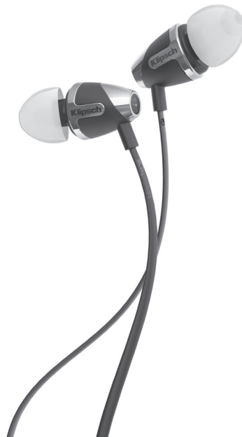
Image S4 Headphones